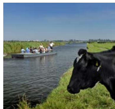
Wandelen of varen door een uniek natuurgebied

Als het werk is afgerond, kunnen wandelaars (geen honden, fietsers en brommers!) hun hart ophalen in dit unieke stukje natuur. Begin volgend jaar volgt de officiële opening. Over de details daarvan ontvangt u nog bericht.