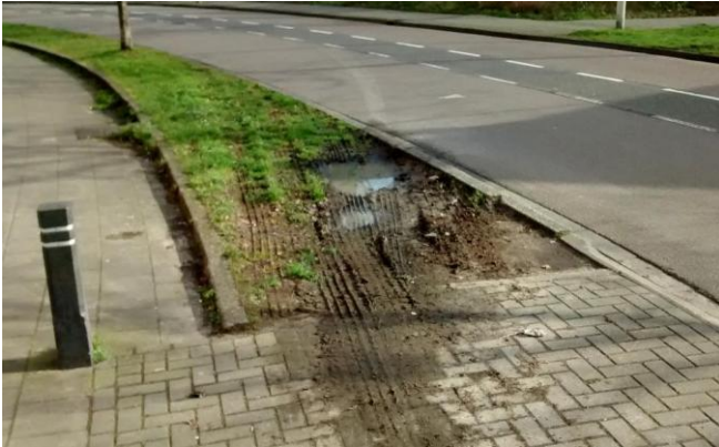
Parkeerplaatsen voor de snackbar

Paaltje voor de berm paatsen en de Berm herstellen