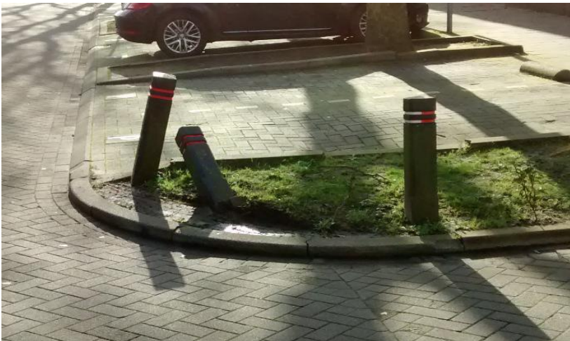
Molenwerf Parkeerplaats Winkelcentrum

Paaltje voor de berm paatsen en de Berm herstellen