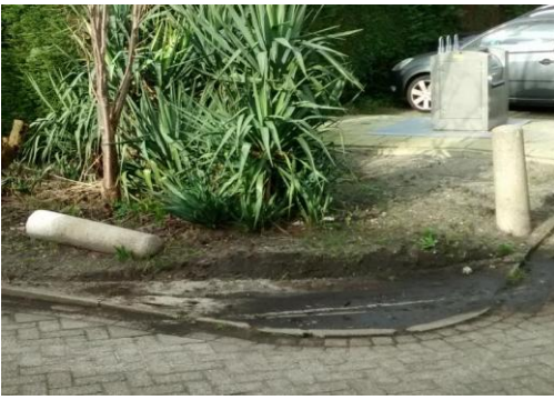
6 jan. Paaltje Geerteveld t.h. nr 54