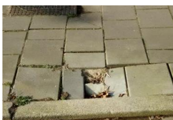
6 jan. Paaltje Westerkoogweg