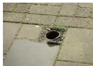
6 jan. Paaltje Glazenmaker t.h. snackbar