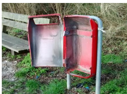
6 Jan. Vuilnisbak Schelpenpad Boomland