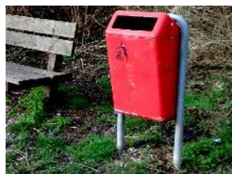
10 jan Nieuwe vuilnisbak geplaatst